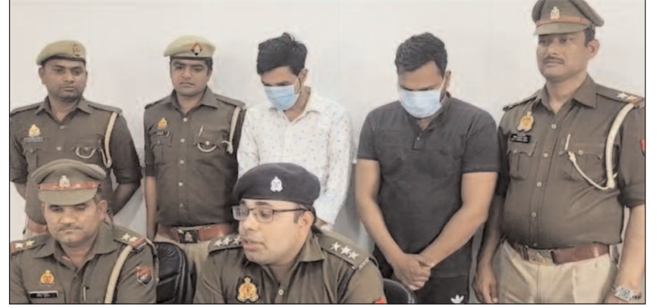
शाना वेव सिटी पुलिस द्वारा एटीएम बदलकर लोगों के खाते से पैसे निकालने वाले 02 शातिर अभियुक्त गिरफ्तार, कब्जे से 72 एटीएम कार्ड व 1150/- रुपये नकद व पेटीएम स्वैप मशीन बरामद। —खबरों का खबर