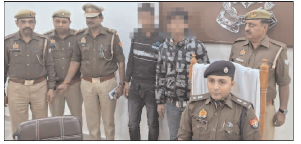
शाना मुरादनगर पुलिस द्वारा हत्या के अभियोग का सफल अनावरण करते हुए 02 अभियुक्तों को किया गिरफ्तार, घटना में प्रयुक्त स्कूटी व आलाकल 01 पिस्टल व 01 जिन्दा कारतुस बरामद। —खबरों का खबर